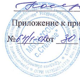
ГРАФИК ОЦЕНОЧНЫХ ПРОЦЕДУР в МБОУ СОШ с. Степное на 2024-2025 учебный год I полугодие СРЕДНЕЕ ОБЩЕЕ ОБРАЗОВАНИЕ