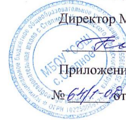
ГРАФИК ОЦЕНОЧНЫХ ПРОЦЕДУР в МБОУ СОШ с. Степное на 2024-2025 учебный год II полугодие НАЧАЛЬНОЕ ОБЩЕЕ ОБРАЗОВАНИЕ