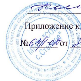
ГРАФИК ОЦЕНОЧНЫХ ПРОЦЕДУР