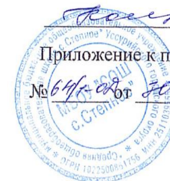
ГРАФИК ОЦЕНОЧНЫХ ПРОЦЕДУР в МБОУ СОШ с. Степное на 2024-2025 учебный год I полугодие ОСНОВНОЕ ОБЩЕЕ ОБРАЗОВАНИЕ