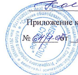
ГРАФИК ОЦЕНОЧНЫХ ПРОЦЕДУР