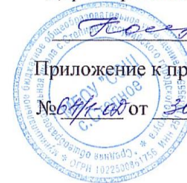
ГРАФИК ОЦЕНОЧНЫХ ПРОЦЕДУР в МБОУ СОШ с. Степное на 2024-2025 учебный год II полугодие ОСНОВНОЕ ОБЩЕЕ ОБРАЗОВАНИЕ